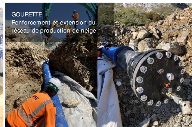
GOURETTE Renforcement et extension du réseau de production de neige