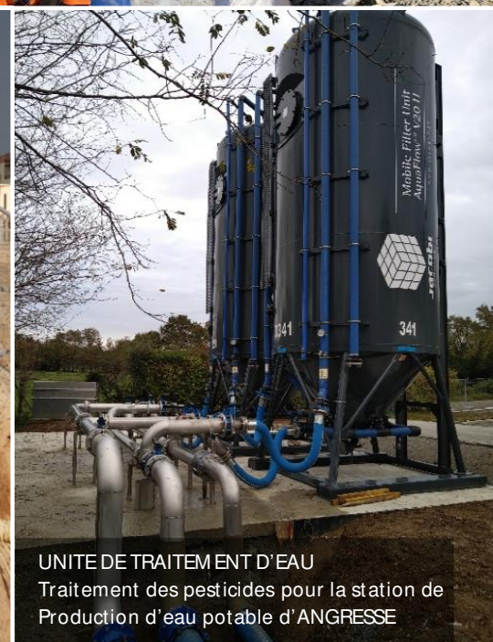
UNITE DE TRAITEMENT D'EAU Traitement des pesticides pour la station de Production d'eau potable d'ANGRESSE