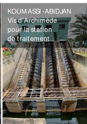
KOUMASSI - ABIDJAN Vis d'Archimède pour la station de traitement