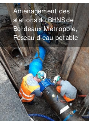
Aménagement des stations du BHNS de Bordeaux Métropole, Réseau d'eau potable