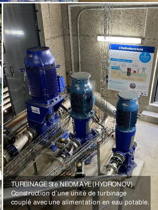
TURBINAGE Ste NEOM AYE (HYDRONOV) Construction d'une unité de turbinage couplé avec une alimentation en eau potable.