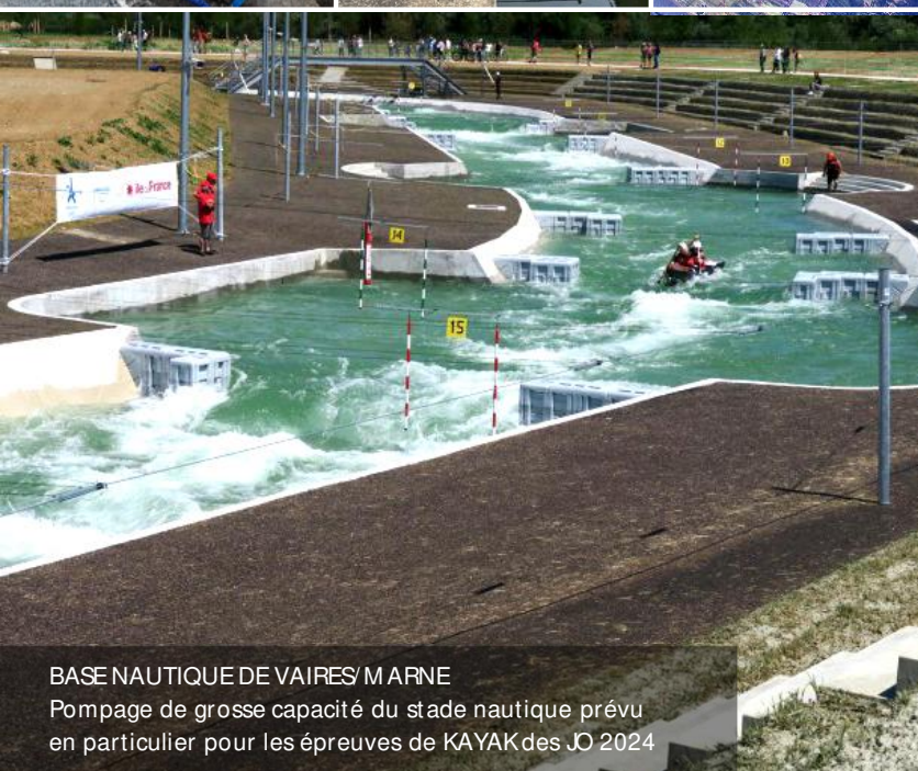
BASE NAUTIQUE DE VAIRES/ MARNE Pompage de grosse capacité du stade nautique prévu en particulier pour les épreuves de KAYAK des JO 2024