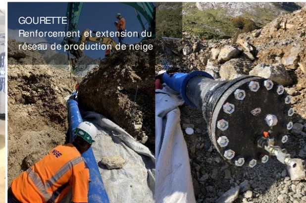
GOURETTE Renforcement et extension du réseau de production de neige