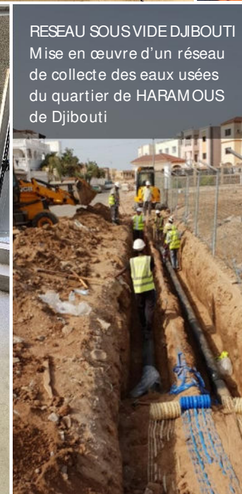
RESEAU SOUS VIDE DJIBOUTI Mise en œuvre d'un réseau de collecte des eaux usées du quartier de HARAMOUS de Djibouti