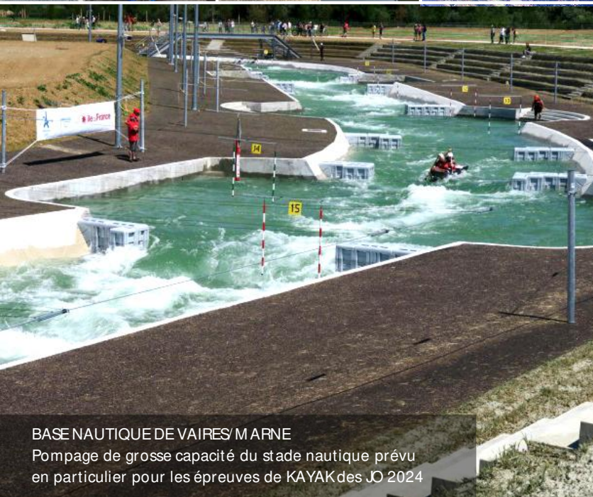
BASE NAUTIQUE DE VAIRES/ MARNE Pompage de grosse capacité du stade nautique prévu en particulier pour les épreuves de KAYAK des JO 2024