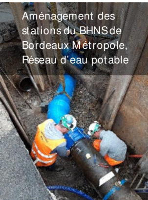
Aménagement des stations du BHNS de Bordeaux Métropole, Réseau d'eau potable