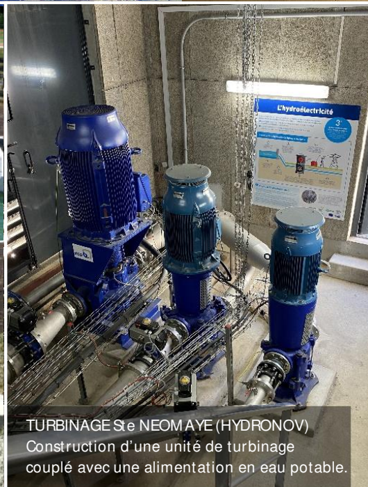
TURBINAGE Ste NEOM AYE (HYDRONOV) Construction d'une unité de turbinage couplé avec une alimentation en eau potable.