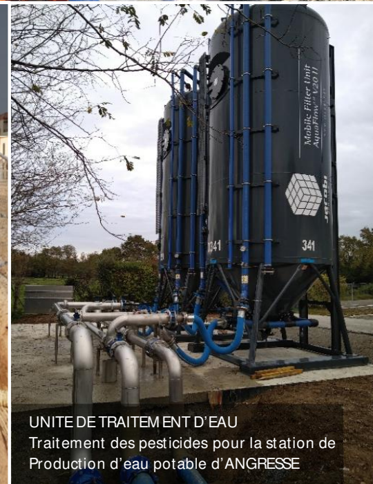
UNITE DE TRAITEMENT D'EAU Traitement des pesticides pour la station de Production d'eau potable d'ANGRESSE