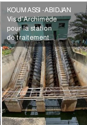
KOUMASSI - ABIDJAN Vis d'Archimède pour la station de traitement