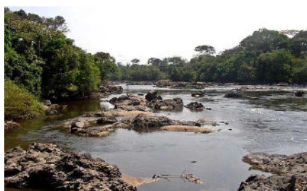
Congo - Etude d'impact environnemental et social pour le projet de mine de fer de Zanaga