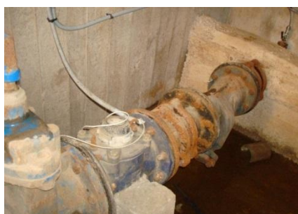
Etude d'amélioration du réseau d'eau à Oujda, Maroc