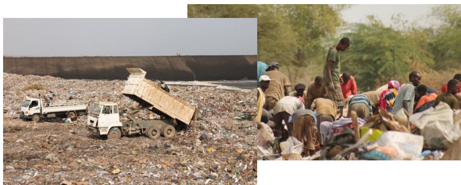
Décharge de Douda à Djibouti