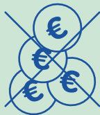
Manque à gagner