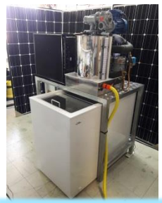
glace en écailles PV2FREEZE®