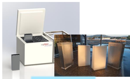
glace en blocs SUN FREEZER®